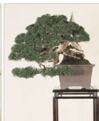
Juniperus chinensis シンバク