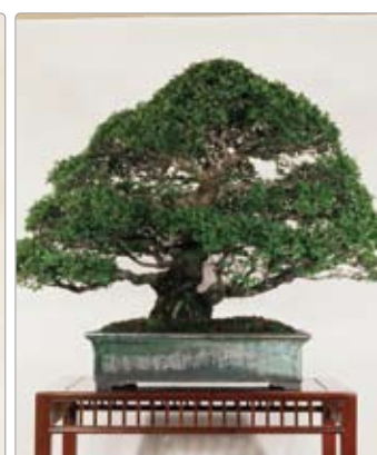
Ulmus parvifolia ニレケヤキ (アキニレ)