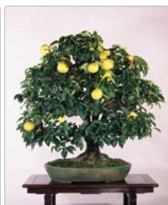
Pseudocytodonia sinensis カリン

Master gardeners form the shaped trees of Japanese gardens to appear as if they aged in a wild, natural environment. In order to give the trees their shape, the branches and trunk roots of the trees are manipulated from the seedling stage, regularly pruned and protected from insects. When moved to other gardens or exported, the roots are dug into a round shape and wrapped in cloth. The photos below exemplify meticulously produced Japanese Macro Bonsai types compatible with climates and soils of the major global markets.