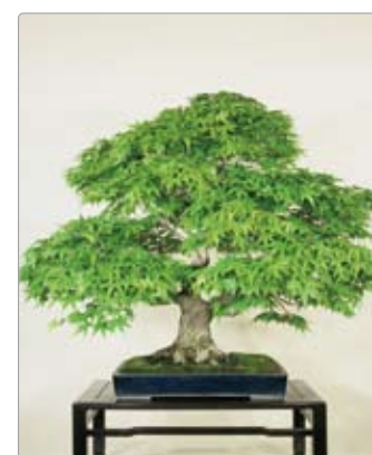
Acer palmatum 'Ukon' モミジウコン