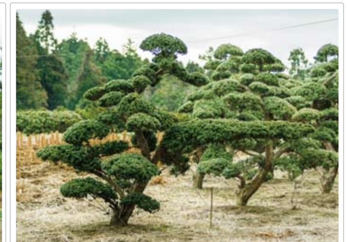
Taxus cuspidata var. nana