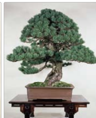
Pinus parviflora ゴヨウマツ