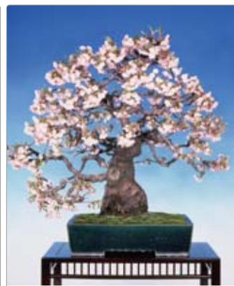
Cerassu sp. サクラ