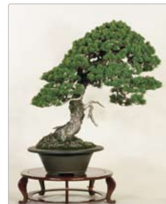
Pinus parviflora ゴヨウマツ