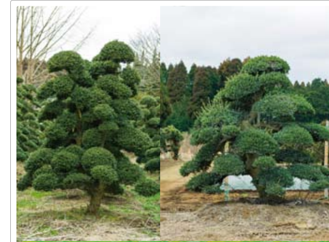
Ilex crenata "kinme"