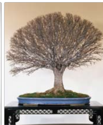
Zelkova serrata ケヤキ