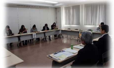
第13回みのりセミナー

農林水産省のデータによると、女性は農業就業人口の約半分を占めています。また、女性が農業経営に参画する経営体は売上や収益力が向上する傾向が見られる等、これからも女性農業者の活躍が期待されます。女性農業者を応援するため、北見支局においては「農政について伝える」「現場の声を汲み上げる」活動として女性農業者の方々との意見交換会等を予定しております。