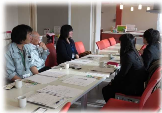
研修生と北海道農政事務所との意見交換の様子

JAところでは、農業経験の浅い女性農業者を対象としたフォローアップを行っており、そのひとつが「みのりセミナー」です。平成28年3月8日の「みのりセミナー」では選果場、育苗センター等の施設見学の後の時間をいただき、北見支局職員による農業施策等に関する説明を行いました。受講者からは農業政策や食料自給率、日本の農畜産物の輸出、女性農業者の活動等、日頃から疑問に思っていることについて意見や質問をいただきました。