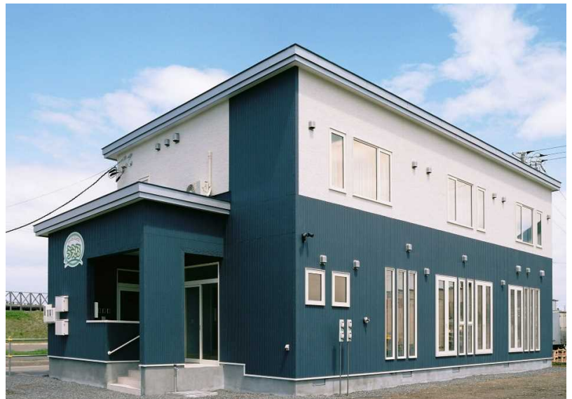
女性専用研修宿泊施設 ファーマーズハウスうえる

また、JAところでは、農業研修にも力を入れており、平成24年3月には女性専用の研修施設を新築し、多くの女性農業者を輩出しています。研修生は道外出身者も多く、農業未経験の方が大半を占めますが、受け入れ農家の丁寧な指導により、安心して研修生活を送っているようです。