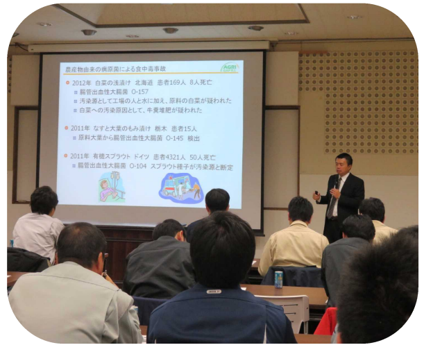
講演「GAPを正しく理解する」

午前の部では、①アジアGAP総合研究所の講師による講演「GAPを正しく理解する」、②流通業界から「GAPを求める流通・企業の事情」について、情報提供をいただきました。