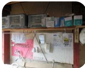
資材、農薬等の管理を徹底