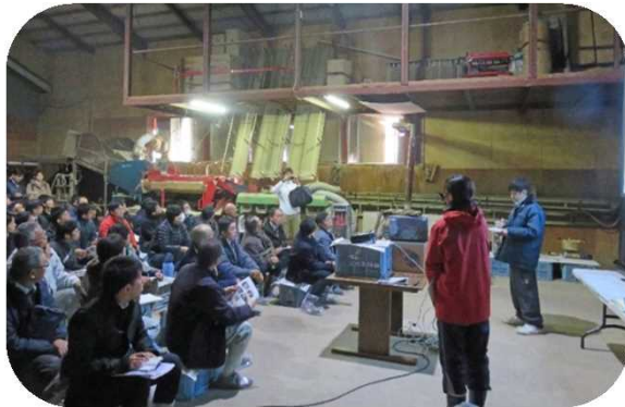
森谷ファームから取組経緯等の説明

参加者からは、「農業者の意識改革という点で、GAPに取り組む必要性を感じることができた」、「実際の管理現場を知ることができ勉強になった」等の感想が寄せられました。