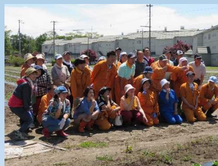
「作業が終わり、笑顔で集合写真」

町内の企業と連携した農福連携の取組をこれからも応援して行きます。8月の収穫時には、カラスの被害に遭わずに真っ赤なトマトが収穫されることを祈っています。