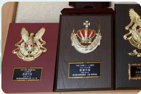
一番左が思い出の平成10年地区共励会の盾

就農当初は、規模を拡大するにも農地がなく、限られたほ場で所得を上げるために単収を上げることを目指しました。お父様や近隣の農家仲間、農機メーカーの担当者から技術やノウハウを得て、耕作に反映し、また、土壌診断に基づく土づくりをはじめ、施肥や耕うんの深さなどに工夫を重ねたそうです。その努力が結果を見せたのは、就農して8年目、平成10年の地区共励会。その後連続入賞し、現在も地区の平均を上回る高収量の技術をキープしています。ひとつひとつのほ場の土壌や作物の状態の観察や、複数の条件を実際に試し比較されているというお話には、農業に向き合う真摯さと挑戦の精神を感じ、「農業は手間暇かけた努力が収穫の時に形となって表れるので、やりがいがある」という言葉には実感がとてもこもっていました。