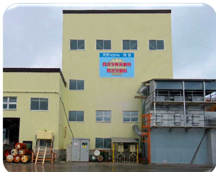
【常呂町産業振興公社】

このようなビジネスモデルが、今後さらに発展し、地域を盛り上げることに大いに期待します。