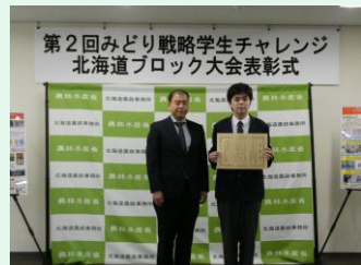
北海道中標津農業高等学校