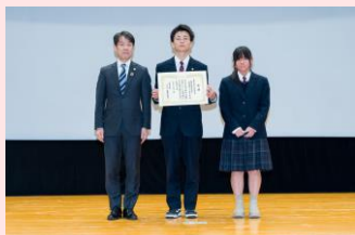
北海道真狩高等学校