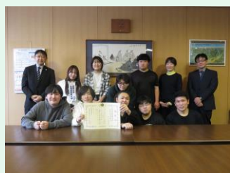
拓殖大学北海道短期大学