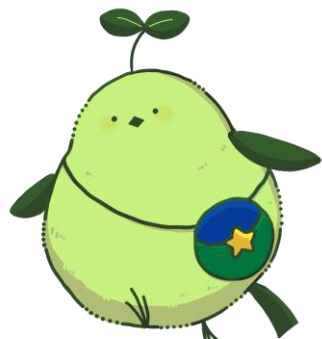
北海道農政事務所 みどりの食料システム戦略 公式マスコットキャラクター シマリーフィ

主に入省1～6年目の若手職員で構成しており、生産者や関係事業者・機関・団体等との意見交換等を通じて、消費者の食と環境への関心を高め、環境に配慮した消費行動への変容を促す様々な取組を企画展開しています。