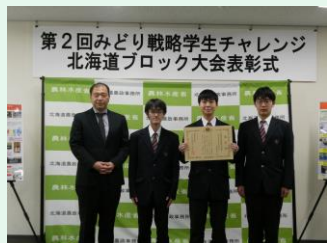
北海道大野農業高等学校