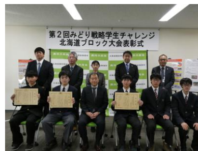
北海道農政事務所長賞等 受賞した3校の全体写真