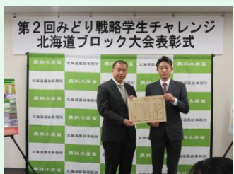
北海道立農業大学校