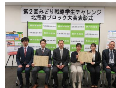
JAグループ北海道会長賞等 受賞した2校の全体写真