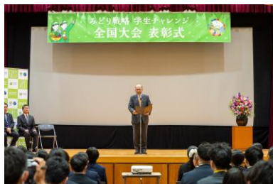
根本農林水産副大臣の 冒頭挨拶