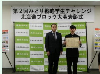
北海道壮瞥高等学校