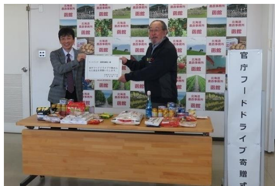
昨年度の取組の様子

MAFF Ministry of Agriculture, Forestry and Fisheries 農林水産省