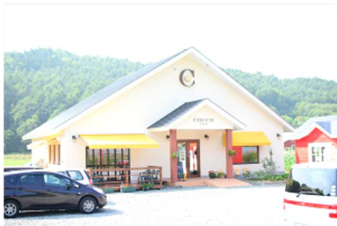
▲「ココテラス」 6次産業化整備支援事業を活用

焼きたてカリカリのクッキーシューに、自家産有精卵を贅沢に使用したカスタードがとろ〜り。他にも、クリームブリュレやエッグタルトなど、たまごの魅力が詰まったスイーツが盛りだくさん。