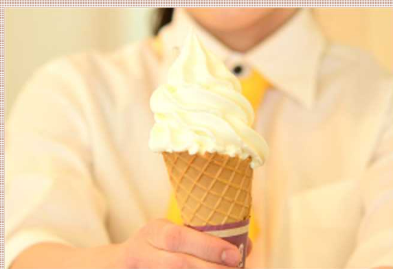
たまごソフトクリーム