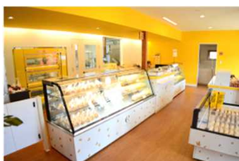
▲「ココテラス」 店内直売所