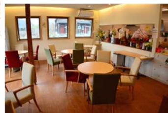
▼「ココテラス」 カフェスペース