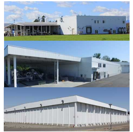
▲上：農産物加工処理施設 第1工場 中：第2工場 下：冷凍冷蔵庫（4000 t）

▲左：一般消費者向け「そのまま枝豆（冷凍）」 右：一般消費者向け「むき枝豆（冷凍）」