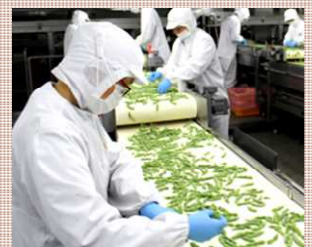
加工施設での手選別の様子