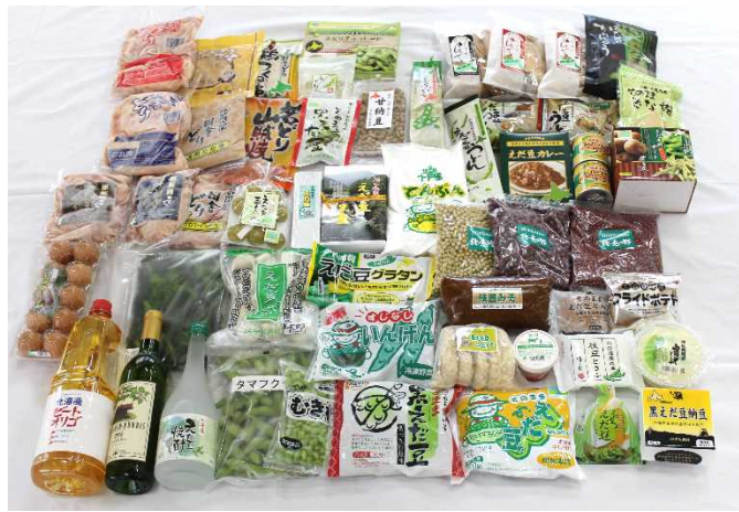
▲バリエーション豊富な農産物加工品

「そのままえだ豆」「むき枝豆」は、とれたての旬の味をいつでも楽しめるように、収穫から3時間以内にブランチング、瞬間冷凍処理し、自然の風味と鮮度を保ち「おいしさを密封」しています。 ぜひ、料理やおつまみに旬の味をお楽しみください。