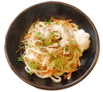
地元的美瑛豚を使用した 人気の『塩豚うどん』