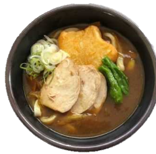
自社栽培の馬鈴薯を使った いもち入りのカレー南蛮うどん

うどん処 麦彩の丘 (むぎいろのおか) 住所：〒071-0473 北海道上川郡美瑛町新星第3 TEL：0166-76-5377 URL：info@k.kumagai farm.jp