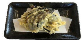
▲お好みに合わせトッピング！