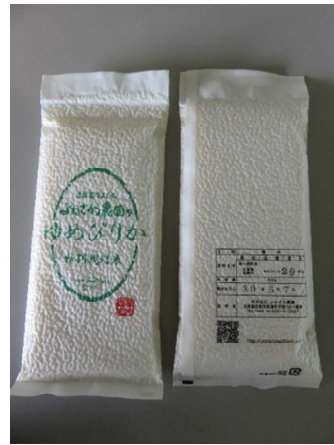
▲「スマホタイプでとっても薄型！」