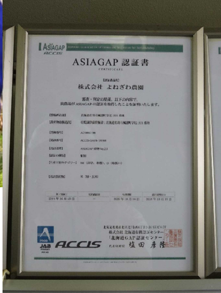
▲平成30年10月には「ASIAGAP」も取得！