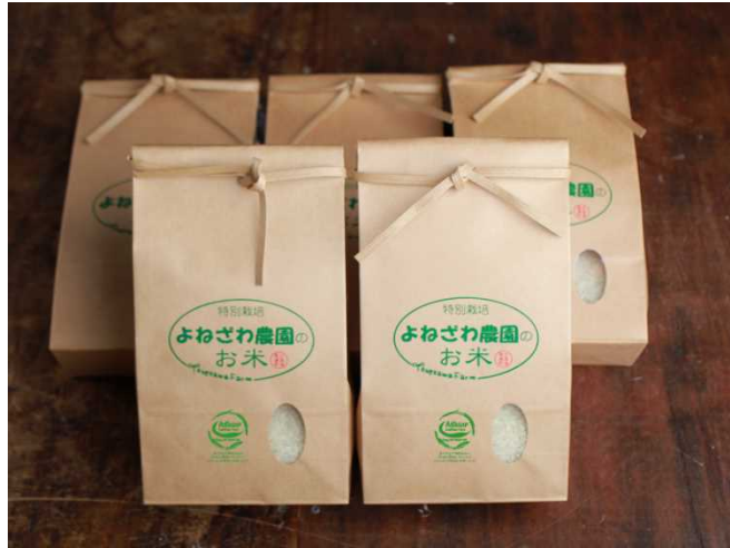
▲「自社ブランドの特別栽培米」