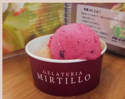
ブルーベリーソルベ

有機JAS認定を受けたブルーベリー農園だからできる、有機ブルーベリーをふんだんに使用した贅沢なジェラートです。当商品は「北のハイグレード食品S」に選定されました。