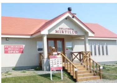
▲「ジェラテリアミルティエーロ」外観

◀ブルーベリージェラート4種 (左からブルーベリーヨーグルト、 ブルーベリーソルベ、 ブルーベリーチーズケーキ、 ブルーベリーミルク)