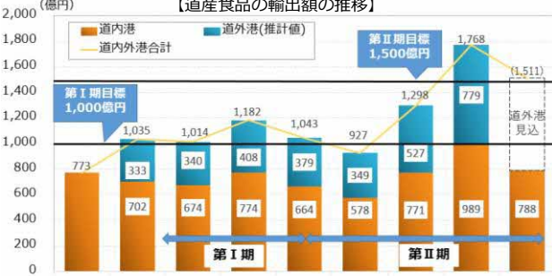
【道産食品の輸出額の推移】