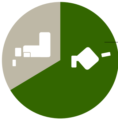
全国における北海道のシェア