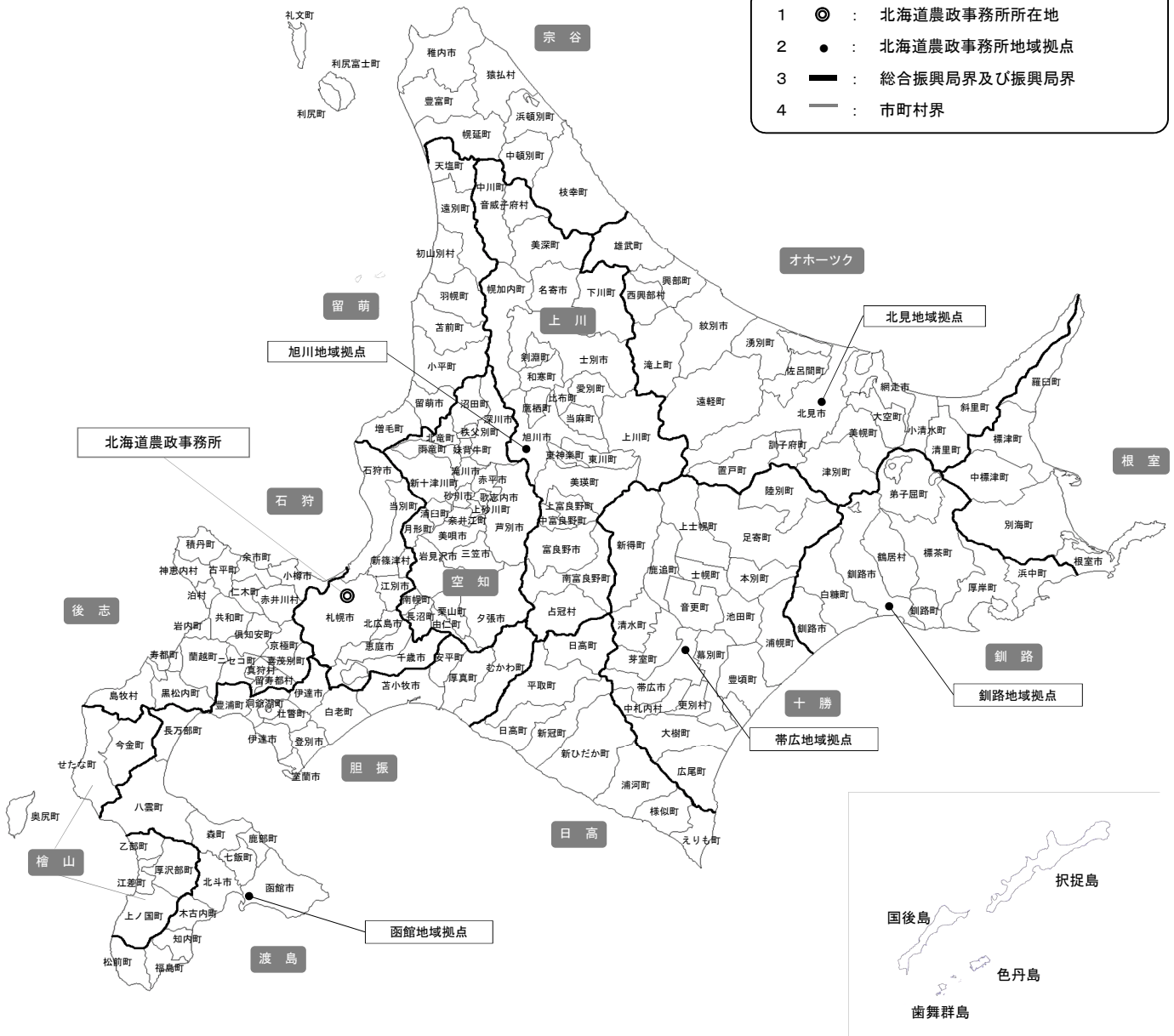
地域拠点等の管轄区域