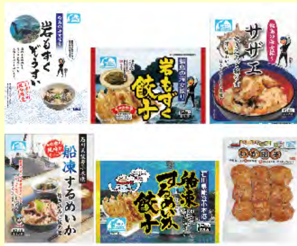
開発商品（輪島市・能登町）