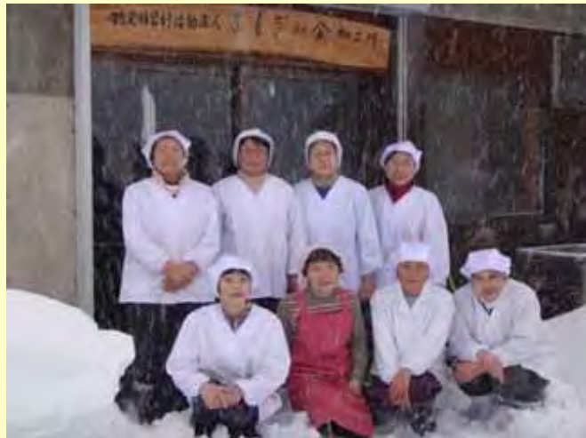
「よもぎの会」のメンバー