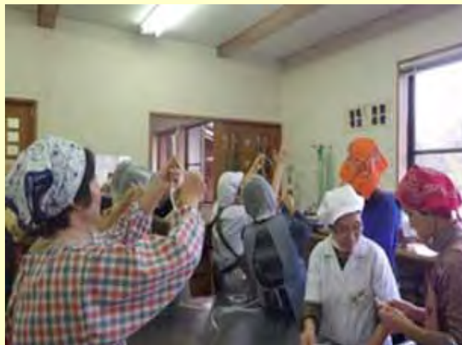
郷土料理体験交流会（かんばん結び）