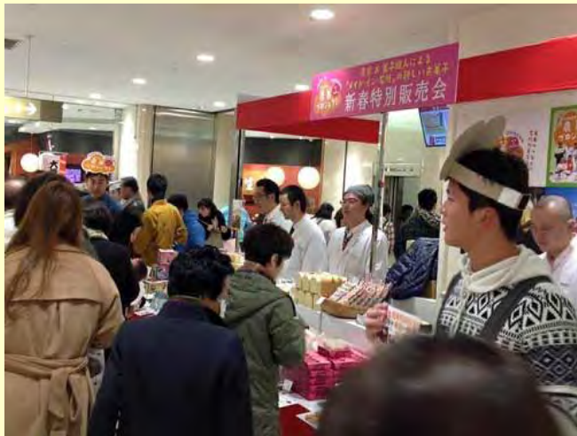
県内百貨店にて初売り販売会