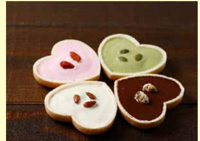
石川コンテスト優勝商品【玄米チョコもなか】