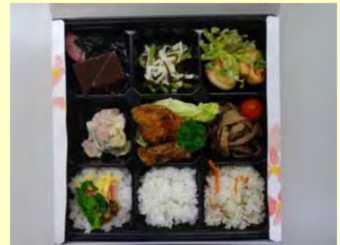
主に牧区産を使用した手づくり弁当