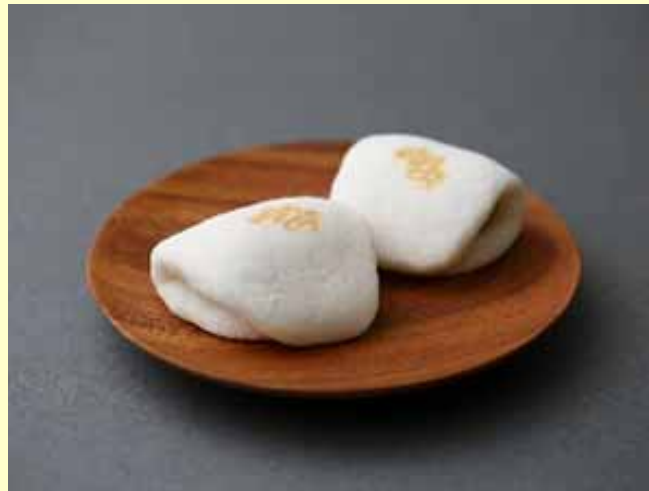
東京コンテスト優勝商品【能登昇龍】