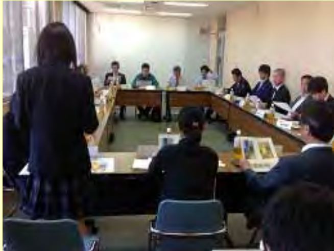
プロジェクト会議の様子