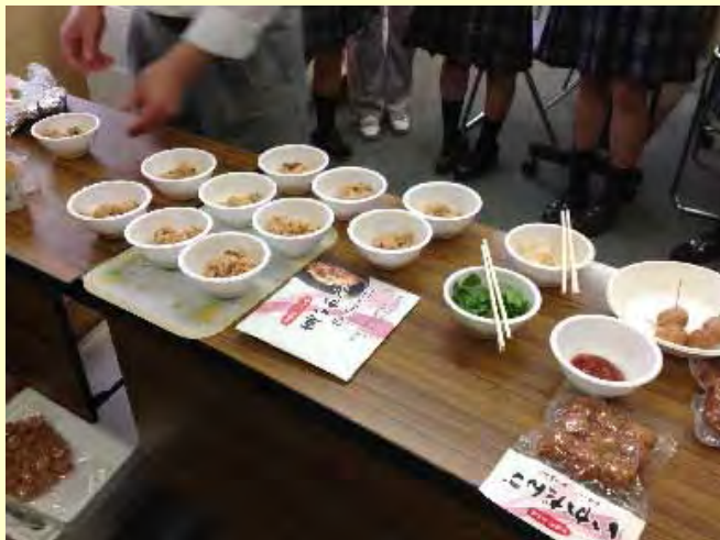
プロジェクトでの商品開発の様子