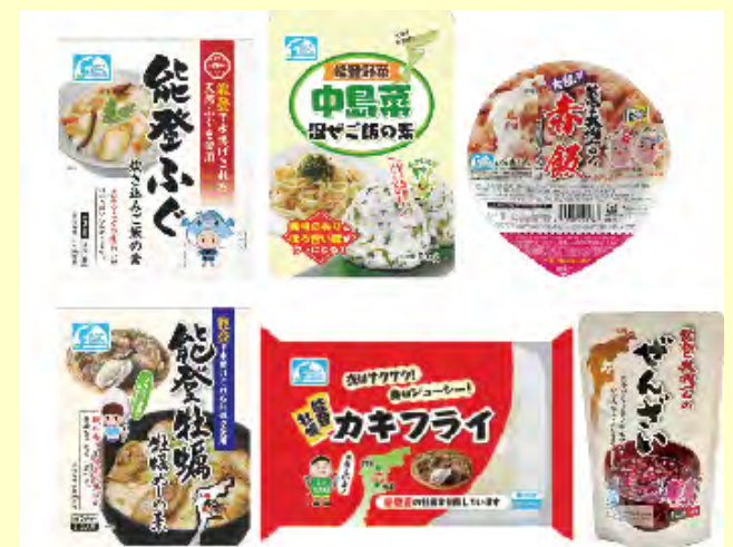
開発商品（珠洲市・七尾市・穴水町）