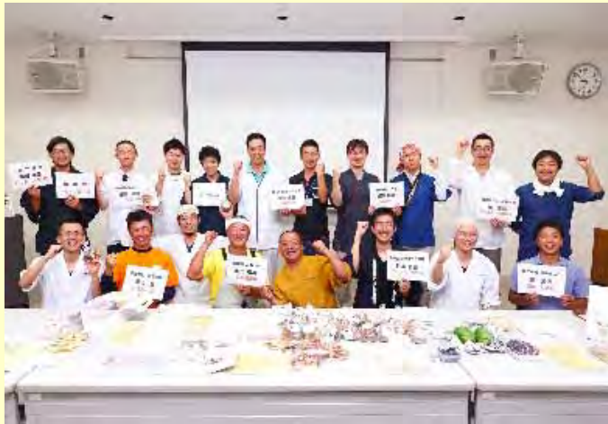
コンテストペア決定