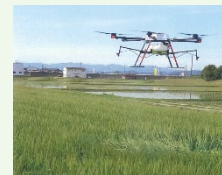
【例】スマート農業機器の活用