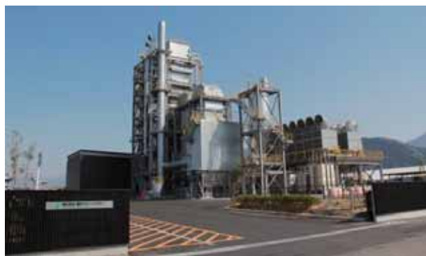
【木質バイオマス施設の外観】