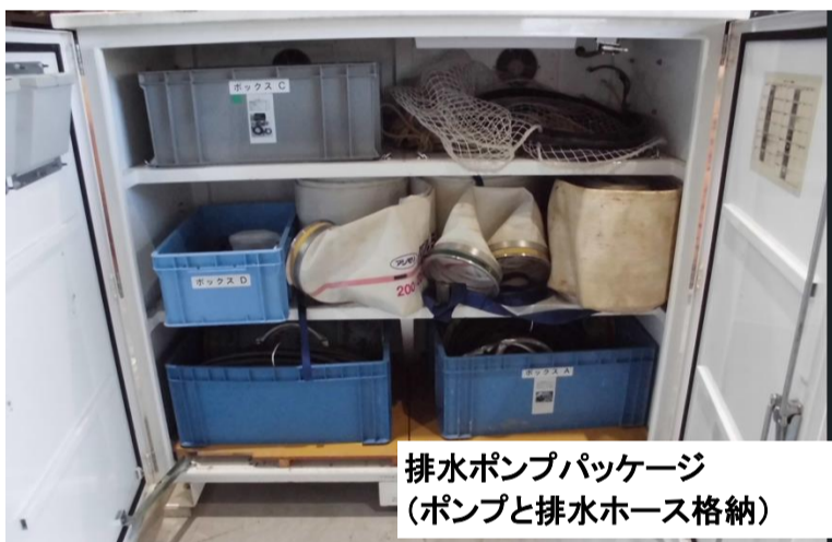
排水ポンプパッケージ (ポンプと排水ホース格納)