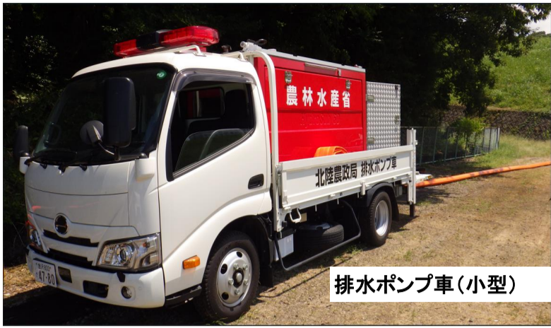
排水ポンプ車(小型)