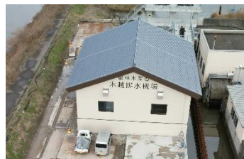
機場建屋完成(令和8年1月撮影)