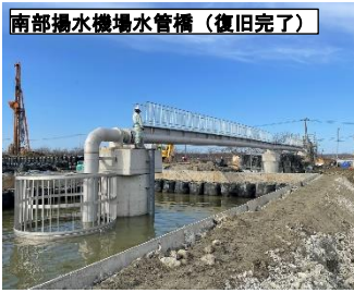
完成した新設水管橋(令和8年2月撮影)