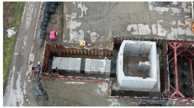
吐出し水槽施工中(令和7年11月撮影)