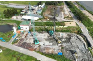
基礎杭工(令和7年9月撮影)