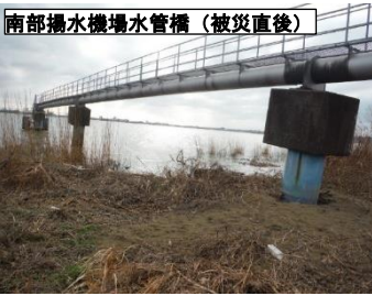
被災により水管橋が傾倒(令和6年1月撮影)

被災後、工事期間中は仮取水管を設置することで取水を継続していましたが、受益農家の皆様には水圧の低下などによりご不便をおかけいたしました。関係者の皆さまのご協力に感謝申し上げます。今後は仮設ヤードの撤去及び堤防復旧工を実施し、直轄災害復旧事業の完了に向けて力を尽くしてまいります。