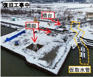
橋脚・橋台の構築(令和7年11月撮影)