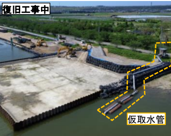
既設水管橋撤去後(令和7年7月撮影)