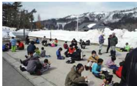
つくたてのお餅でお昼ご飯