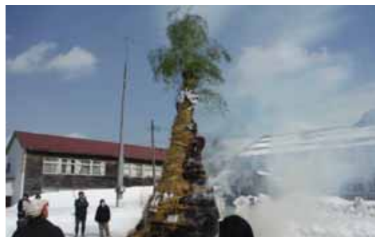
燃え上がる賽の神