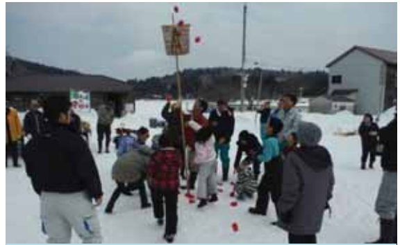
玉入れは延長線にもつれ込む大接戦