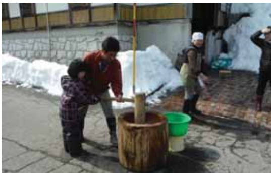
おいしいお餅になりますように

運動会後のごはんは、つくたてのお餅です。地元でとれたモチ米で餅をつき、つくたてのお餅と熱々の豚汁に舌鼓を打ちました。