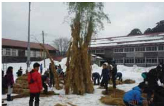
みんなで賽の神造り

雪原の上に竹や藁で大きなやぐら（賽の神）を造り、それを燃やして豊穰と無病息災を祈る伝統的な行事です。賽の神には市内の小学生の書き初めも一緒に燃やされており、よく燃えると字が上手になるといわれています。（地元住民談）