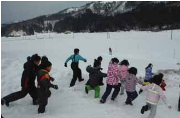
雪の中に埋まっている“お宝”を探して一斉にスタート