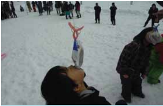
なかなかパンがとれません...