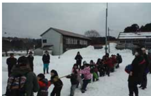
みんな力いっぱい引きました