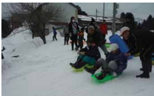
そり滑り（所長 VS 地元代表）

子どもも大人も雪の上で、おおはしゃぎ。景品を賭けた宝探しでは、子供よりも大人たちのほうが必至になって探す一幕も。