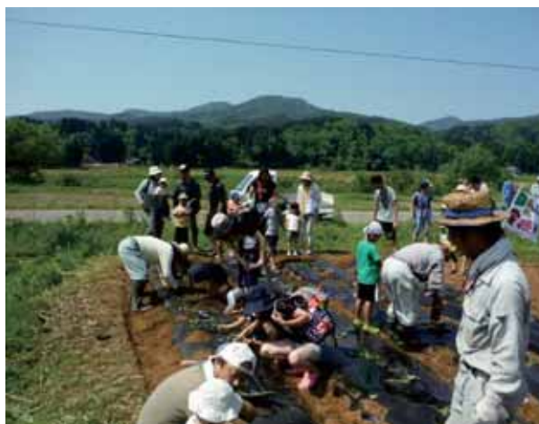
家族や友達、みんなで植えました