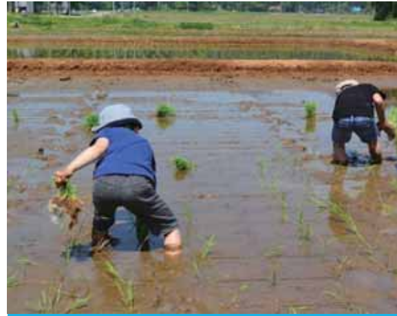
慣れた手つき(?)で植えていきます

イモ植えの後は、水田に移動して田植えを行いました。事前に田面に刻んでおいた格子型の溝の四隅に幼苗を植え付けていきます。初めは田んぼに入るのにためらいを見せた子供達も、最後には手足だけでなく、全身で田植えを楽しんでいました。