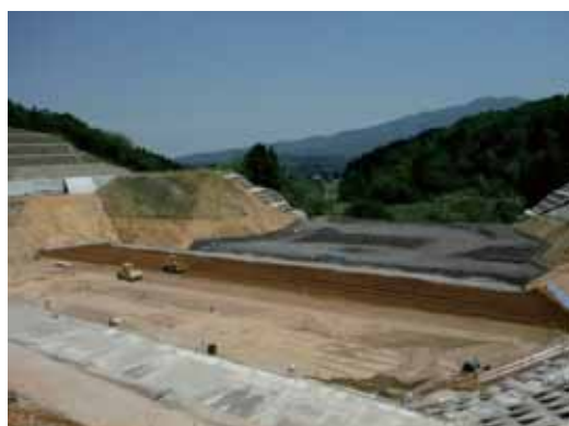
今年度中に盛立を完了します