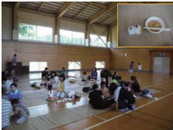
みんなで集まって昼食会

田植えの後は、女谷地区で昨年収穫したお米で作ったおにぎりや豚汁、お総菜で昼食です。地元の方々が作ってくださった料理は、どれもとてもおいしかったです。