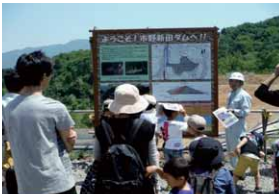
ようこそ！市野新田ダムへ！！

昼食をいただいた後、みんなで市野新田ダムへ移動し、ダム天端から盛立の方法や現在の進捗状況を見学しました。その後、ダム情報室でそれぞれ思い思いの言葉や絵を下流側透水性材に書きました。