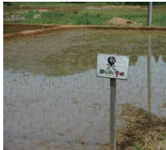
秋の収穫が楽しみです