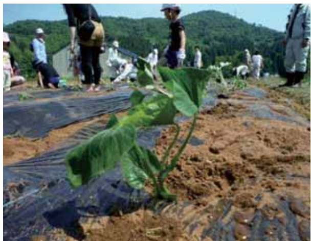
立派に育ちますように