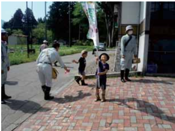
長いお話も終わり、いざ出陣！

田んぼの学校の開校式後、みんなで畑へ移動し、サツマイモの苗を植えました。家族や友達と協力しながら、一本一本丁寧に穴を掘り、苗に土を被せていきます。