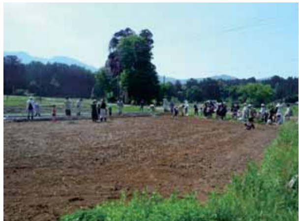
さわやかな青空の下でイモ植え開始！