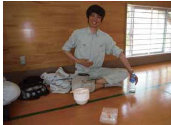
美味しくてつい食べ過ぎちゃった