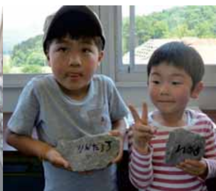
いっぱいお絵かきできました