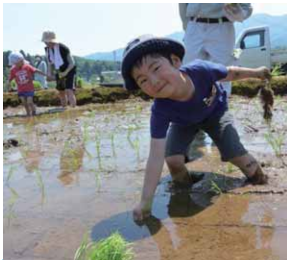
上手に植えられたでしょ?