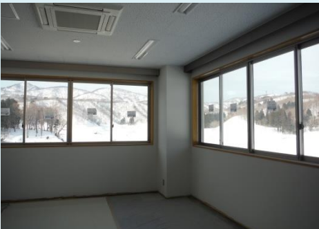
市野新田ダム管理棟2階内部の様子