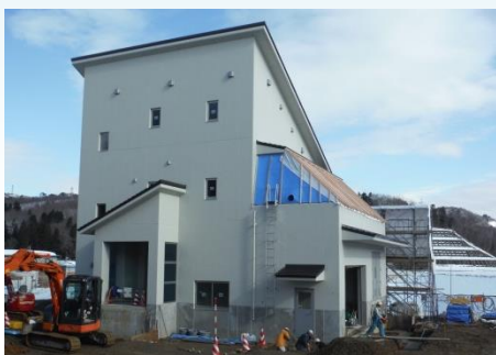
完成間近の市野新田ダム管理棟

市野新田ダムの右岸天端で進む市野新田ダム管理棟建築工事は、3階屋根葺き、外防水塗装を終え、残す床や廊下の仕上げを行い、2月中旬ごろに完成を迎える見込みです。あわせて、管理用の機械等も搬入される予定です。