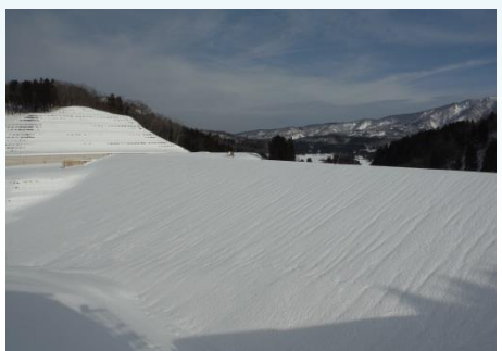
管理棟から見る市野新田ダム堤体上流側