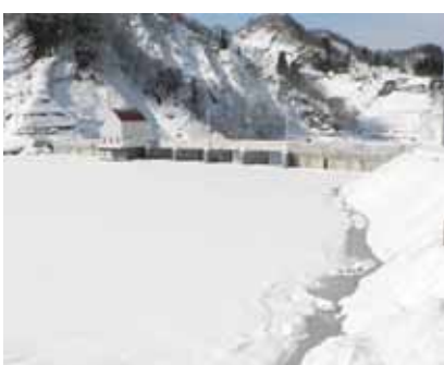
今年2月に満水となった栃ヶ原ダム