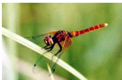
過去の環境調査で生息が確認されたハッチョウトンボ