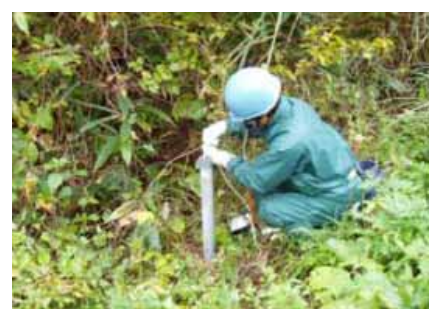
平成21年度地下水位観測実施状況

堤体材料は、右図に示す2箇所から採取する予定です。地点（鶴川ダム原石山）で採れる粒の粗い土砂と地点（市野新田ダム土取場）で採れる粒の細かい土とをブレンドし、ダムの遮水（水を通さない）部分の材料とします。