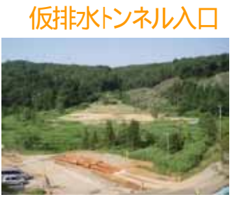
仮排水トンネル入口

付替市道21・132号線工事 市野新田に通じる付替市道を建設する工事です。今後、アスファルト舗装やガードレール等の安全施設を施工し、今年10月に供用を開始する予定です。