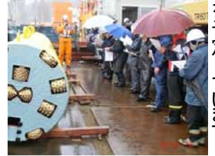
現場見学会を開催(上野工区)

上野工区も、昨年引き続き推進工事を実施し、今年八月に完了の予定です。今後とも、ご理解とご協力をお願いいたします。