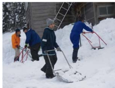
写真10 高齢者住宅の除雪

また、県除雪ボランティア組織「スコップ」を受け入れ、高齢者住宅の屋根雪の除雪の支援を行うとともにボランティアとの交流を深めている。