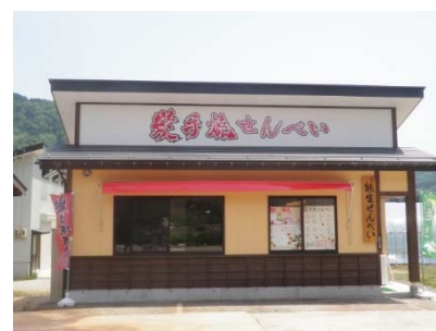
写真6 せんべい工場兼販売所

なお、あぐり能生の代表取締役は、（株）銚・権現ジオの里の役員（副会長）を務めており、協議会や事業の適切な運営に向けて助言している。農家レストランの敷地内に隣接した場所に、自社の「せんべい工場兼販売所」を設置し、双方の売上向上（相乗効果）が期待されている。