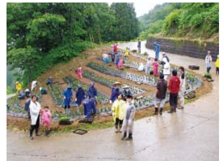
写真8 ふれ愛花壇の共同作業

「元気づくりチーム」では、「地域活性化」と「地域で困っていること」を手助けする「地域応援」をテーマに活動を展開している。「花いっぱい運動」は、地域各家庭に花苗を斡旋する他、集落の花壇（ふれ愛花壇）の整備をしている。また、集落区長からの「困っている」依頼により用水路の草刈り等も実施している。