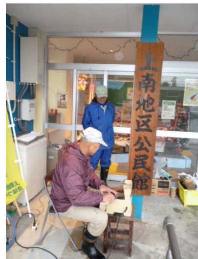
写真2 なんでも屋さん (包丁研ぎ)

平成25年から始めた冬の行事「ふれ愛キャンドル祭り」は地域内外からの参加がある。また、子供たちを対象にした「楽習会」、「あそぼまいか(ロケットづくり等)」、「家庭教育学級(高齢者との竹馬づくり)」の他、高齢者を対象にした「なんでも屋さん事業」(「ワンコイン(100円)サービス」「みんなの喫茶店(カフェ)」「地域サロン」等は好評で、全ての住民が遠慮なく参加・利用できる環境となっている。これらの事業の展開にあたり、協議会では6チームの進捗状況を把握するために全体会議を毎月開催し、情報共有を行っている。