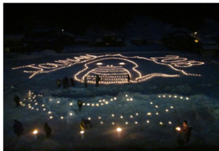
写真11 ふれ愛キャンドル

さらに、東洋大学との連携により、「移住体験モニターツアー」の企画から実行までの間、大学生が定期的に訪れるよう