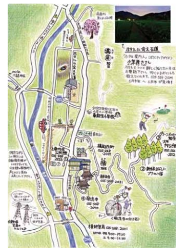
写真9 上南地区ええとこマップ

「観光チーム」では、「上南ええとこマップ」（写真9）を毎年発行しているほか、観光資源である「 ものいで 湧き水」「 わきみず 白滝」「 しらたき 花立峠」等に案内看板を設置している。また、お盆前と年末に主な2集落を拠点にイルミネーションを設置し、帰省客等へのイメージアップ・PRを行っている。