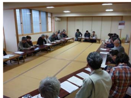
写真1 協議会（全体会議）の様子

また、「上南地区の住民数が増加、文化資産等の継承」を地域づくりの最終目標として、「地域住民の参画」と「資源の有効活用」をキーワードに策定し、一度に全ての事を実行できないことから、「緊急性／重要性」「みんなでできること」「すぐできること」というテーマで絞り込みを行い、地域づくりに関するコンセプトと「スローガン」を設定した。