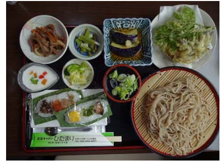
写真7 農家レストランの定食（笹寿司セット）

なお、ぜんまいの加工等作業（農家男性9名）及び農家レストランの運営（農家女性11名）に係る雇用が生まれ、約1,200万円の賃金が支払われ、地区に還元されている。