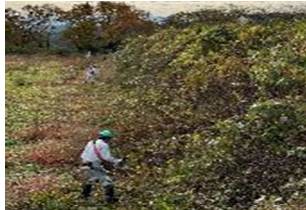
耕作放棄地の再生