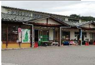
山田農林産物処理加工直販施設