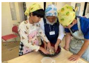
都市住民のそば打ち体験