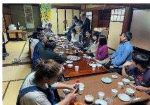
郷土料理を囲んでの語らいの場