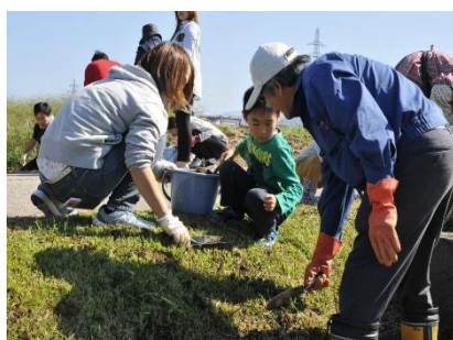
写真2 景観維持活動