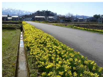
写真3 スイセンロード