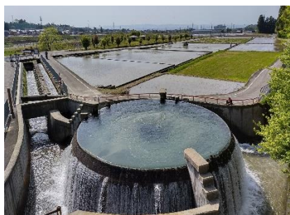
写真1 東山円筒分水槽

用水の供給源である美しい「東山円筒分水槽」を守り、多くの方々に見てほしいと、集落内の農地維持活動のほか、泥上げ等の管理作業に地域をあげて取り組んでいます。また、農道や水路法面などに植栽された「スイセンロード」や遊休農地へのヒマワリの植栽は、良好な景観形成に寄与するとともに、世代間交流活動として継続し、地域資源への愛着を醸成しています。