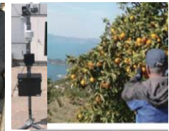
中山間でも使用可能な 気象センサーロボット