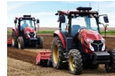
自動走行トラクタ の無人協同作業