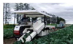
重量野菜の 自動収穫機