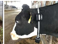
家畜生体データ センシング