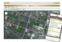
経営管理システム