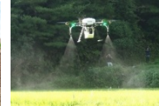
ドローン農薬散布