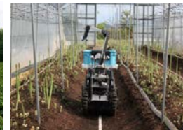
自動収穫ロボット