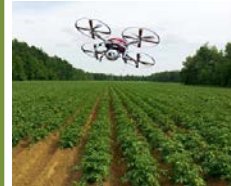
センシング結果に基づく 施肥・防除、受粉等