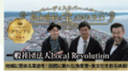
取組紹介のPR動画(グランプリ地区)