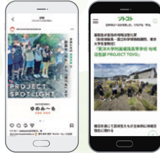
メディア媒体(インスタ、ソトコ)での記事掲載