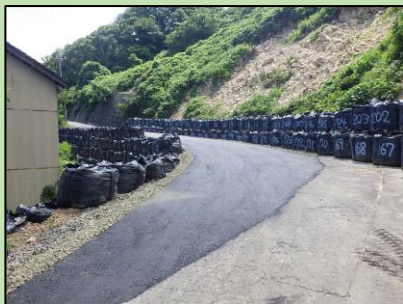
工事用道路の復旧状況