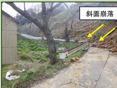
工事用道路の被災状況