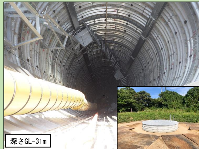
地すべりブロックの地下水を排除するための集水井の設置(完成)