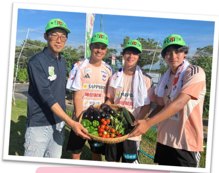
「谷口農園いくとぴあ出張所」 での野菜の収穫