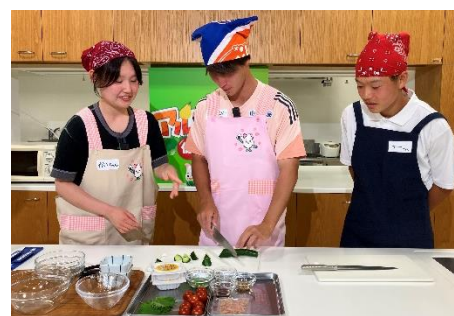
食育啓発動画では大学生が考えた朝食レシピを選手が調理

さらに、活動の様子を積極的に報道機関へ紹介することで、食育活動への共感と理解の輪が、より幅広い世代へ広がるよう取り組んでいます。