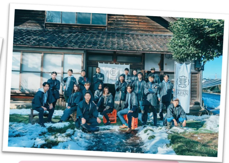
若手農家コミュニティ「F-35」