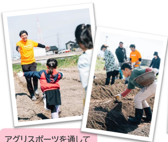
アグリスポーツを通して 農業を身近に