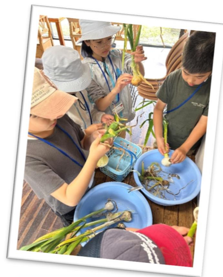
収穫した野菜の調理