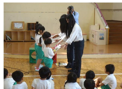
子どもたちに食育絵本を贈呈

また、地域の図書館にも絵本を寄贈するなど、 地元住民の方々を対象とした食育の普及にも積極的に取り組んでいます。