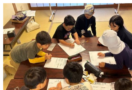
「こども農楽舎」実施後の振り返りの様子

学校や地元農家の協力を得ながら、子どもたちのニーズに応じたプログラムを企画することで、地域全体の魅力を伝えていくことを目指しています。