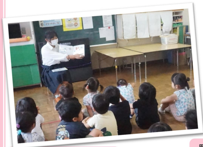
食育絵本読み聞かせ