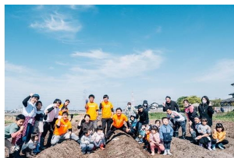
アグリスポーツに参加した子どもたち