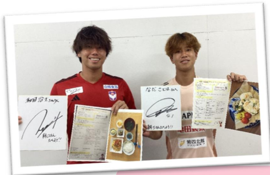
小中学生を対象とした 朝食レシピコンテスト