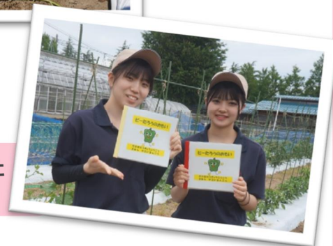
野菜畑から生まれた 食育絵本