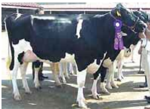
H25年 乳用牛共進会 (新潟県)