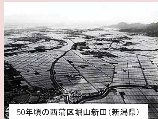
50年頃の西蒲区堀山新田(新潟県)