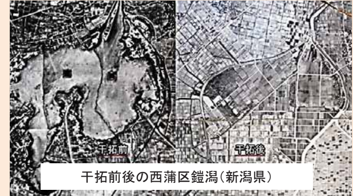
干拓前後の西蒲区鑑潟(新潟県)