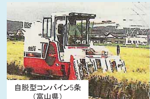
自脱型コンバイン5条 (富山県)