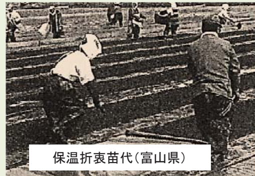
保温折衷苗代(富山県)