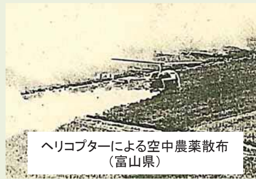
ヘリコプターによる空中農薬散布 (富山県)