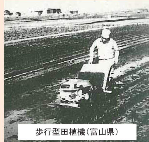
歩行型田植機(富山県)