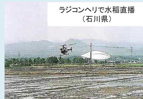
ラジコンヘリで水稲直播 (石川県)