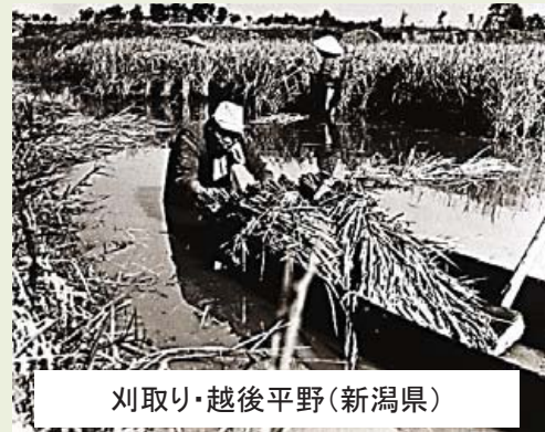
刈取り・越後平野(新潟県)