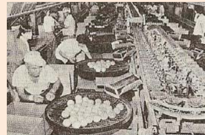
なしの選果風景(石川県)