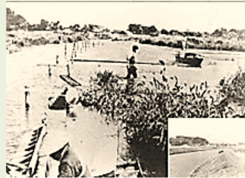
氷見市十二町潟の排水改良 (富山県)