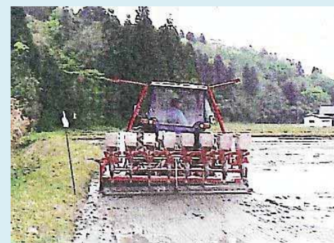
直播8条植え・田植機8条植え (富山県)