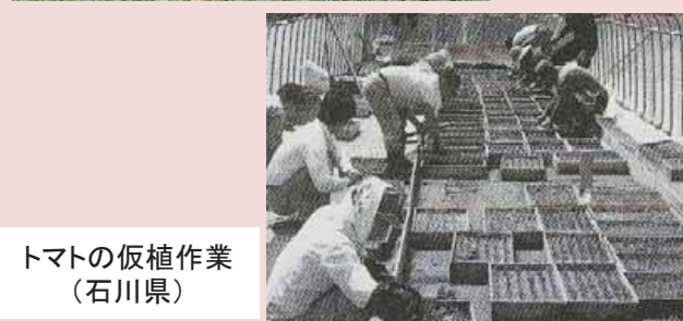
トマトの仮植作業 (石川県)