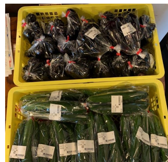
袋詰めして店頭へ