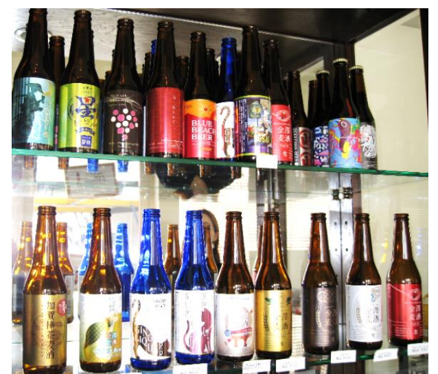
商品ラインアップ