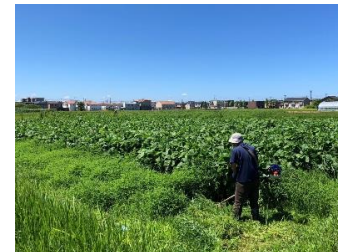
空き農地で黒豆を栽培