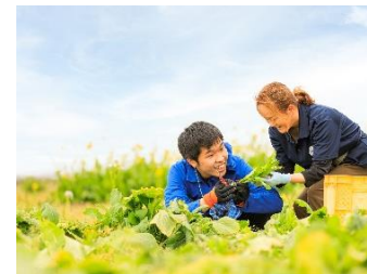
野菜農家での収穫