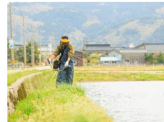
米農家での草刈り