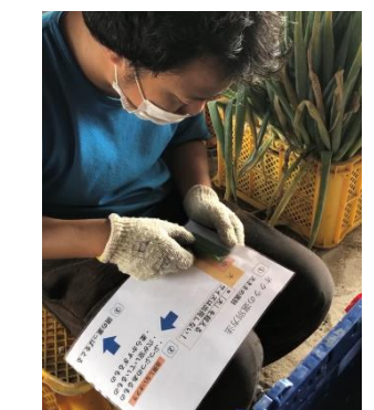
視覚基準を用いた選別表