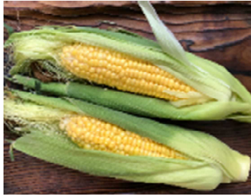
朝採りのスイートコーン(ゴールドドラッシュ)