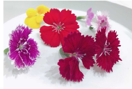
エディブルフラワー各種