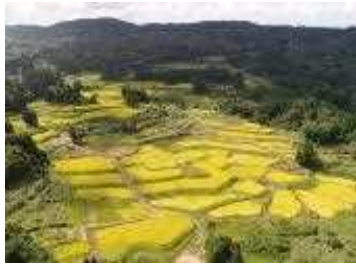
一之貝地区の棚田