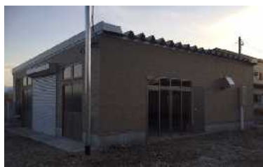
えだまめの加工所