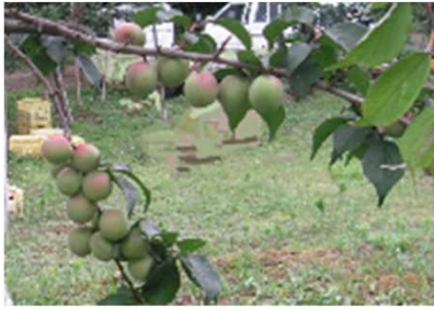
収穫期の“越の梅”と選別作業