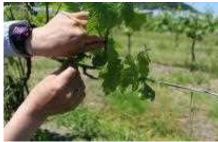
福祉事業所によるぶどうの除葉作業