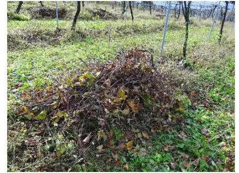
拾い集めたぶどうの枝