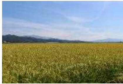
恵まれた自然環境で育つ岩船産米