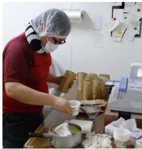
そばのむき実計量、袋詰め作業