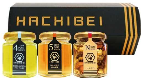
八米 (HACHIBEI) プレミアムセット