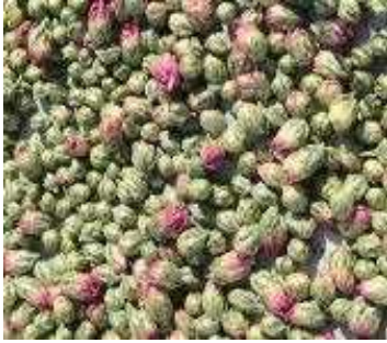
食用菊の蕾 菊茶の材料に