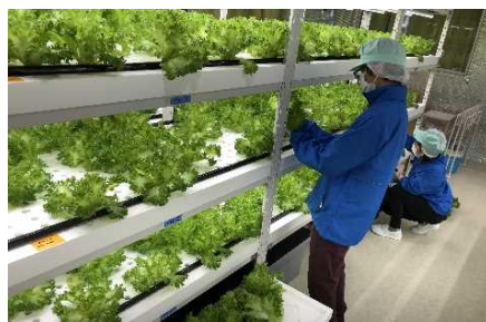
葉物野菜(レタス)収穫