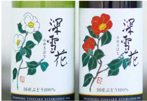
岩の原ワイン造り