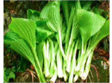
自然食ブームで人気があるウルイ