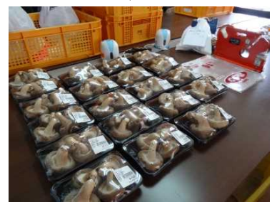
出荷を控えた椎茸