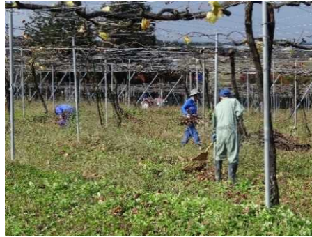
剪定したぶどうの枝を拾い集める作業の様子