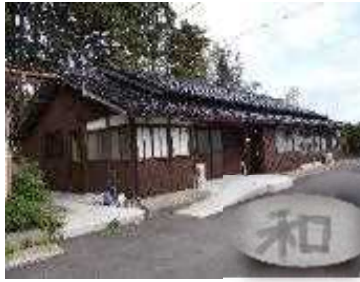
アートサロン「和(やわらぎ)」に飾られている障がい者の描いた絵