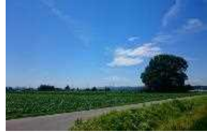
長岡市越路中沢地区