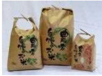
減農薬で栽培したお米