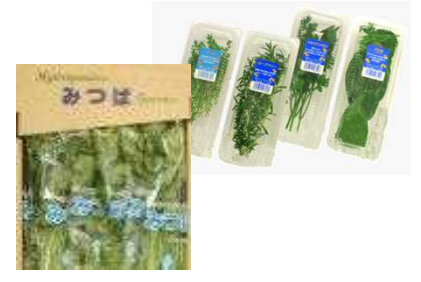
安心・安全なみつばやハーブ等を食卓へ