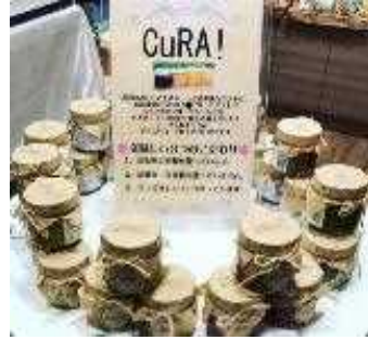
茄子、トマト、ル・レクチェのジャム