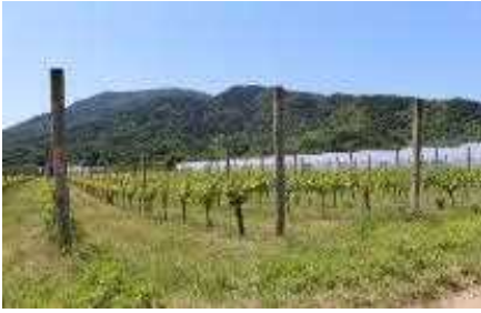
角田浜のぶどう畑