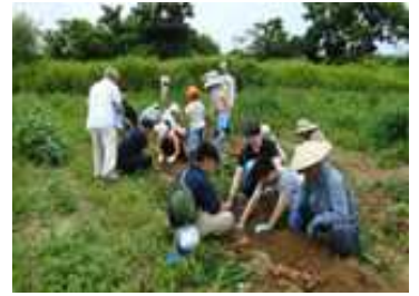
農園でのばれいしょの収穫