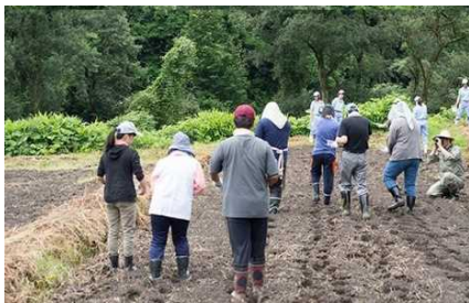
赤谷地区でのそば蒔き