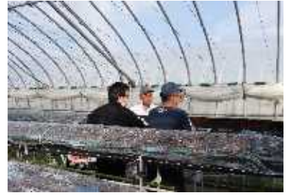
いちごハウスでの作業