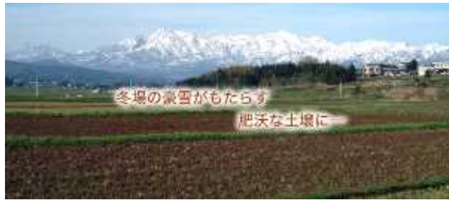
雪深い山あいの里「えちご清里」