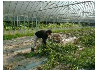
きゅうり、トマト収穫後の株除去作業