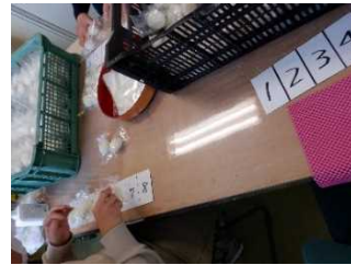
切りもちの袋詰め作業