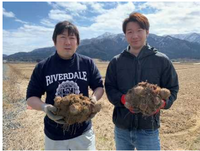
五泉市特産の美味しいさといもです