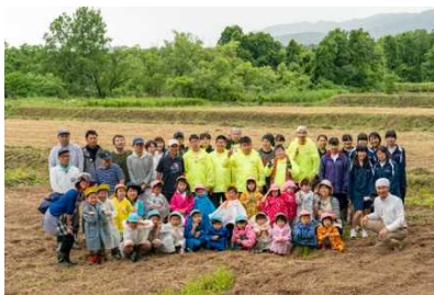
農福連携による商品をお届けします