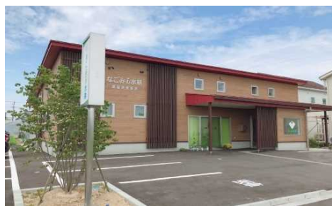
なごみの水耕 外観