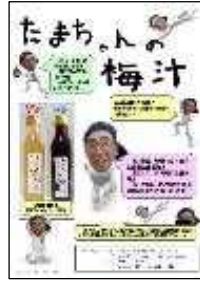
“越の梅”の梅エキスと梅干し(ラベル貼りも連携)