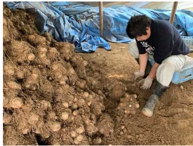
さといもの分離作業