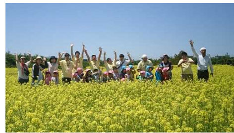
八米お花畑プロジェクト(菜の花)