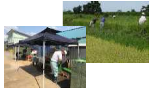
苗箱洗いと水田の雑草除去作業