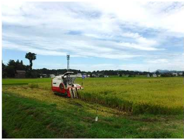
平成30年産米の稲刈り