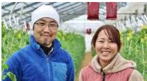
農福連携による「ユニバーサル農園」を目指す