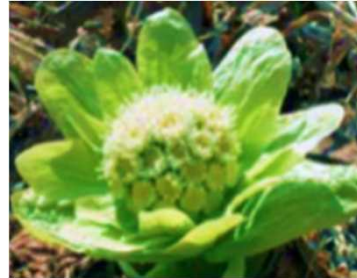
栽培管理されたふきのとう