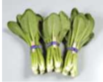
寒さが厳しいほど甘みが増す八色菜