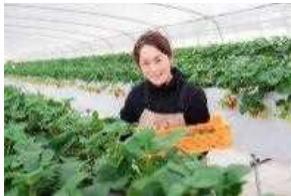
心潤う芳醇いちごをお届けします