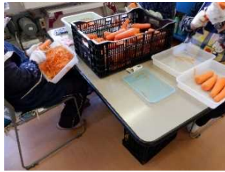
にんじんの皮むき作業