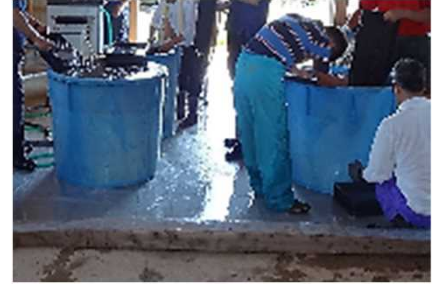
福祉事業所による水稻苗箱洗い