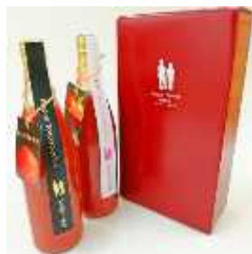
無塩・無添加のトマトジュース