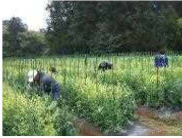
採種カンラン(キャベツ)管理作業