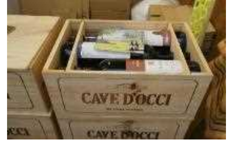
収穫したぶどうからできたワイン