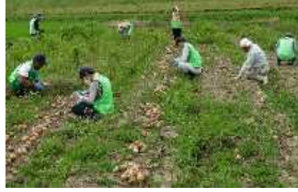
福祉事業所とのたまねぎの収穫