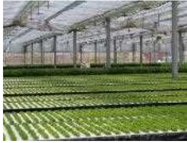
大型ハウスでのみつば水耕栽培