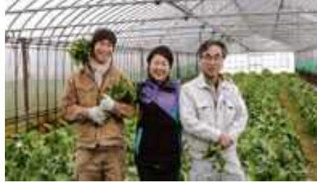
ハウスの野菜とスタッフ