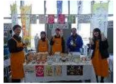
新潟県農福連携マルシェ2018