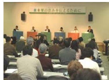
水土里フォーラム