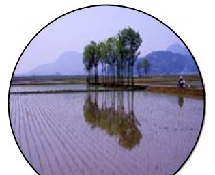
4. 美しい風景を伝承します