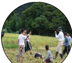
5. 心の安らぎや、潤いを与えます