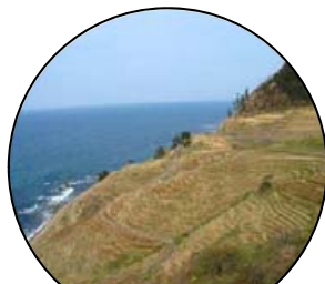
2. 自然災害を防ぎます