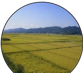
1. 私たちの食を支えます

この農村の水土里は世代から世代に引き継がれてきた国民共有の財産であり、今後も保全していく必要があります。