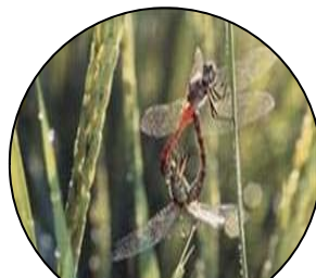
3. 生態系を保ちます