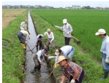
水路のえざらい(清掃)