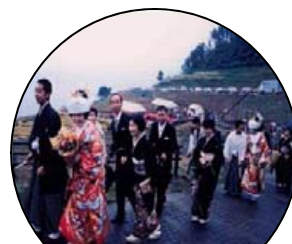
7. 郷土の文化を育み伝えます