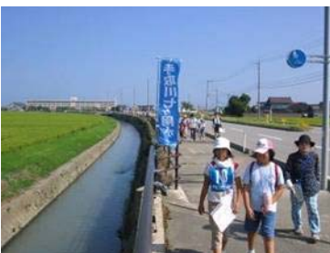
水土里ウォーキング

農村のかけがえのない水土里を学び、次世代に守り伝えるため、水土里の保全・ふれあい活動では水土里ウォーキング、フォーラムなど、さまざまな活動に取り組むとともに、今後の活動予定について広く紹介していきます。