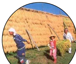
6. 人間の感性を豊かに育てます