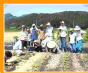
技術研修会の開催