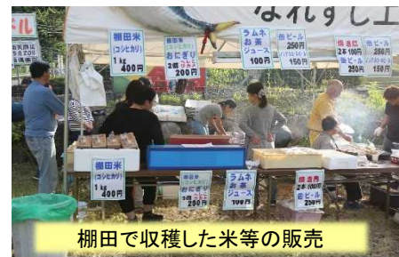
棚田で収穫した米等の販売