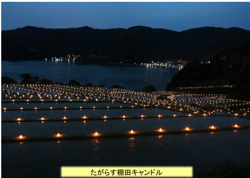
たがらす棚田キャンドル