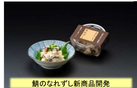
鯖のなれずし新商品開発