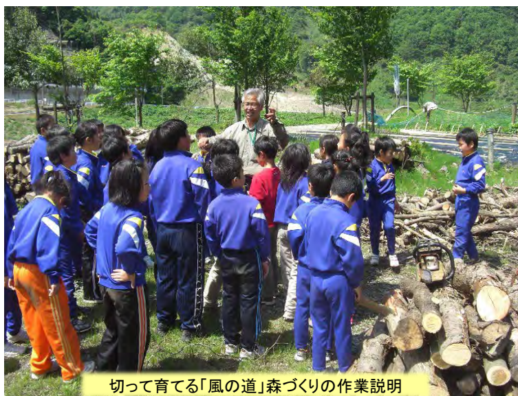
切って育てる「風の道」森づくりの作業説明