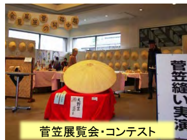
菅笠展覧会・コンテスト