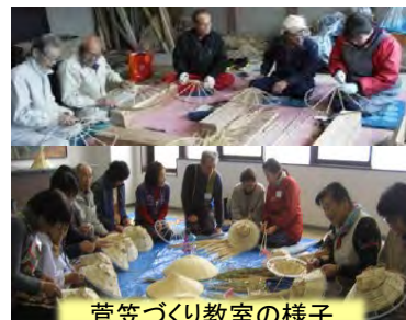
菅笠づくり教室の様子