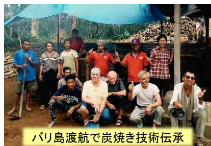
バリ島渡航で炭焼き技術伝承