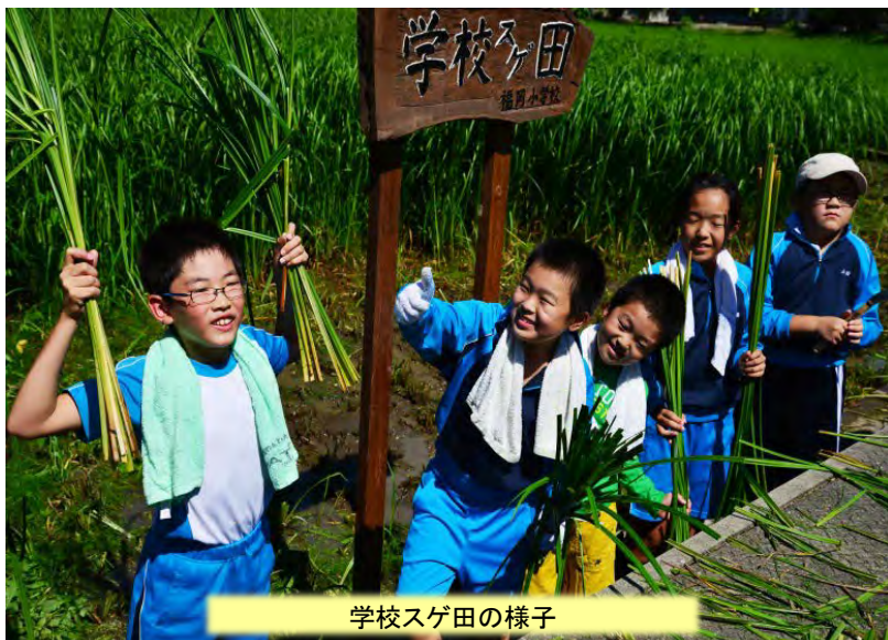
学校スゲ田の様子