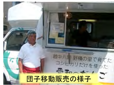
団子移動販売の様子