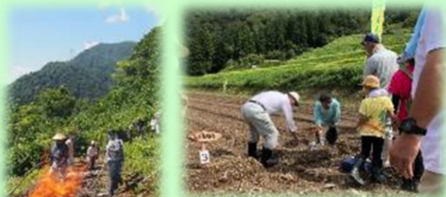
農作業 (五箇山かぶら)