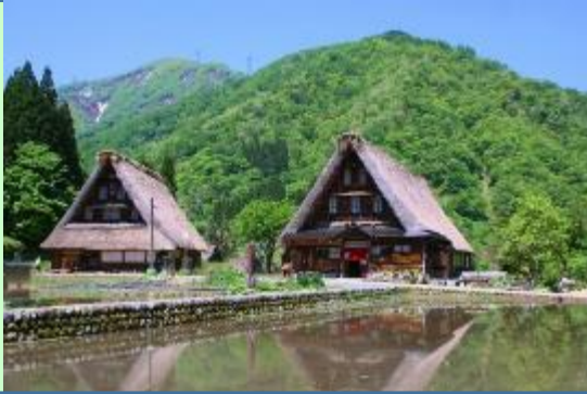
世界文化遺産 五箇山菅沼合掌造り集落