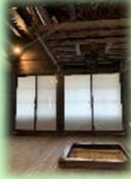
合掌造りコテージ