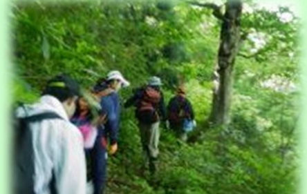
ブナ原生林散策トレッキング