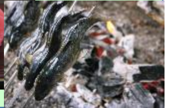
五箇山かぶら漬・岩魚