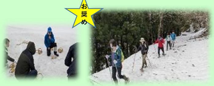
かんじきトレッキング