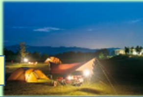
オールシーズンキャンピング