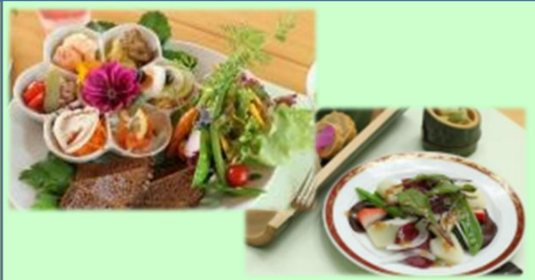
地元産100%の四季折々の採れたて食材