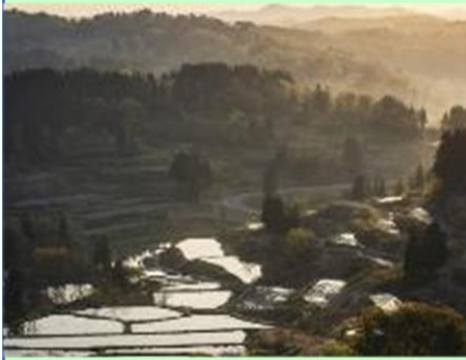
四季折々の美しい棚田