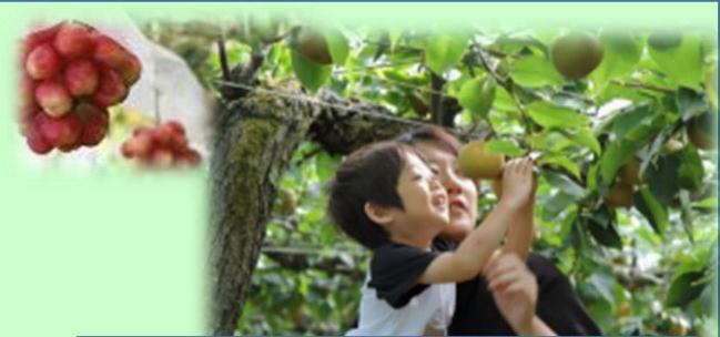
旬の果物収穫体験