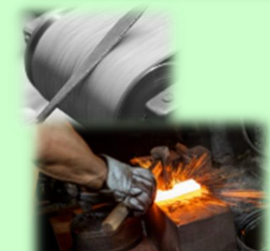
伝統的な鍛冶ものづくり体験