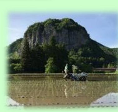
オーガニック体験