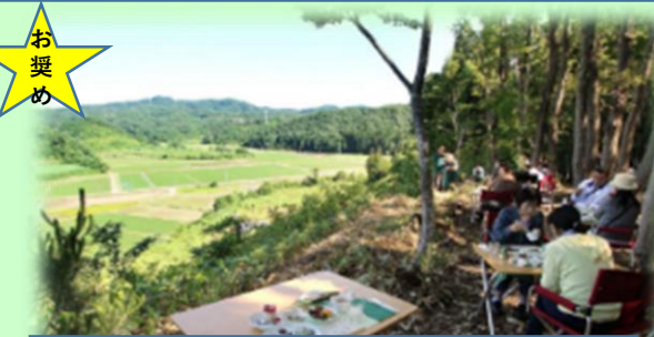
畑の朝カフェ体験