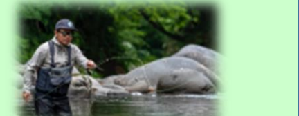
秘境でフライフィッシング