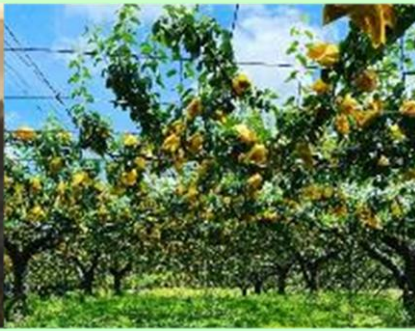
新潟県名産『ルレクチエ』