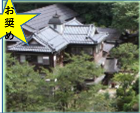
国登録有形文化財 嵐溪荘