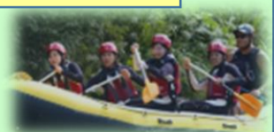
ラフティング体験