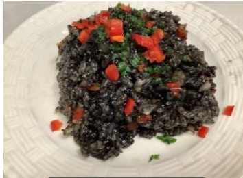
開発メニュー (ブラックパエリア)