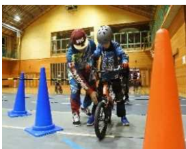
スポーツアクティビティ