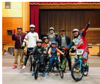
スポーツコンテンツ体験