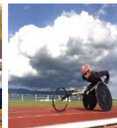
パラスポーツ マラソンコース