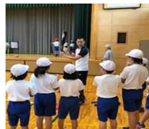
スポーツコンテンツ (野球教室)