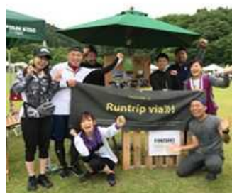
ランニングイベント