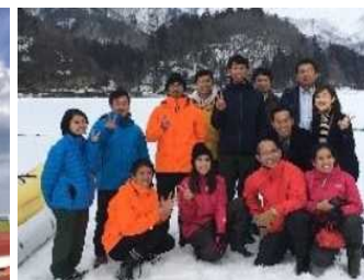
インバウンド モニターツアー