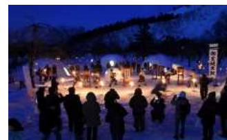
雪美洞祭(せつびどうさい)