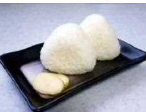
南魚沼産こしひかり