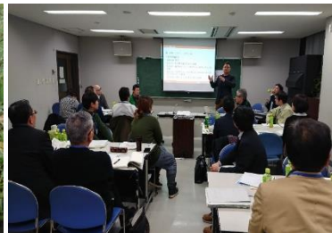
インバウンド研修